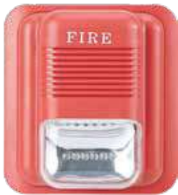
سارينا كبيرة فلاشر 3A