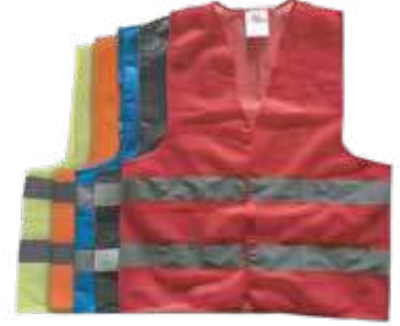
سترة سلامة 3A 60 جرام