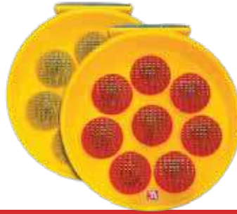
لمبة طاقه شمسيه صن فلاور