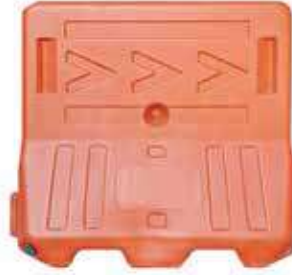
حاجز مرور بلاستيك