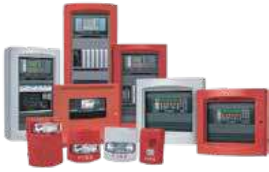
أنظمة الإنذار المعنون (Simplex)