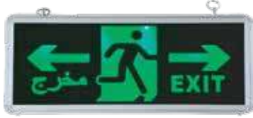
مخرج طوارئ متنوع