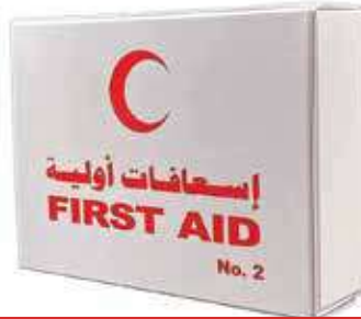
صندوق اسعافات اولية 2