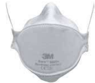
كمام حماية 3M