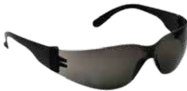
نظارة حماية فولتكس (نحيف ، عريض) مع ربطة راس