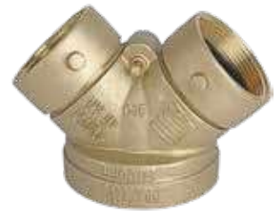
وصلة دفاع مدني