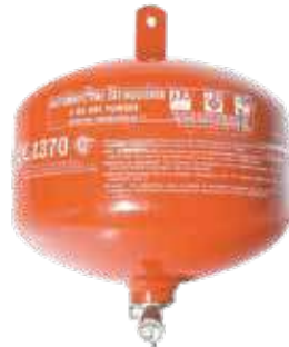
طفاية حريق رغوة اوتوماتك (6 ل)