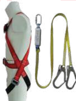
حزام امان 3A 2 هوك