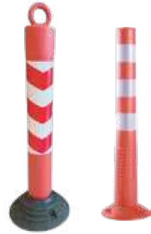
قمع تحذيري مرن