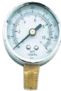
ساعة ضغط مضخة