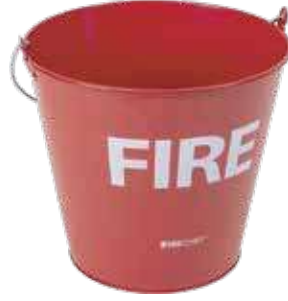
سطل حريق رمل