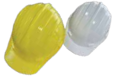
خوذة وطني عادي