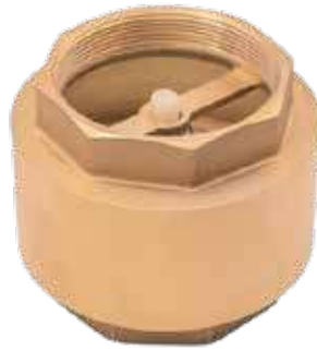
محبس رداد جميع المقاسات