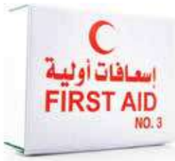
صندوق اسعافات اولية 3