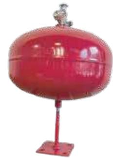
طفاية حريق بودرة اوتوماتك (6 ك ، 10ك)