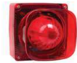
سارينا خارجية 3A