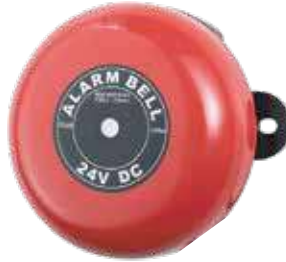
جرس إنذار 24 فولت 3A