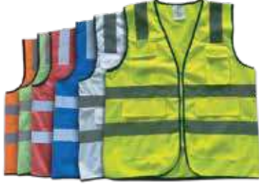
سترة سلامة 3A جيب 120 جرام