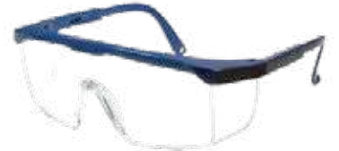
نظارة شفاف (عريضة ، نحيفة)