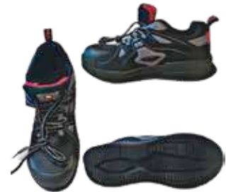
جزمة سيفتي 3A X1 مهندسين