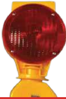
لمبة طاقه شمسيه قاعدة صغير احمر