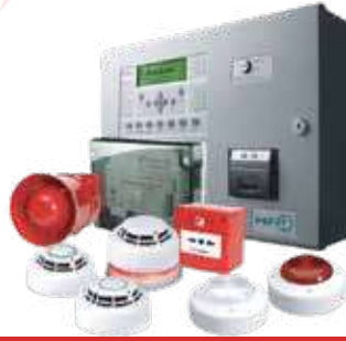
لوحة أنظمة الغازات