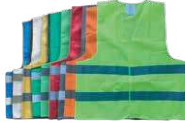
سترة سلامة 3A 100 جرام