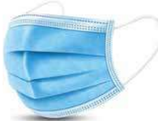
كمامات حماية ازرق