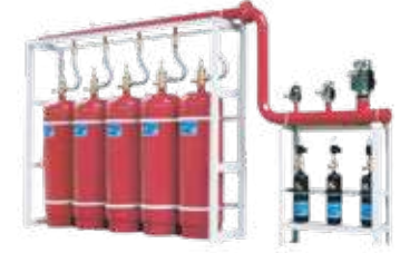
نظام اطفاء FM200