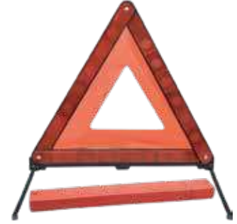
مثلث بلاستيك عريض