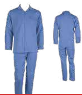
بدلة عمال متعددة الالوان