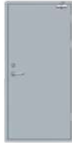
باب طوارئ صيني