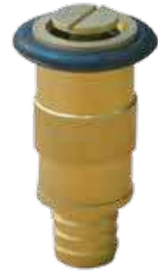
قاذف نحاس برم