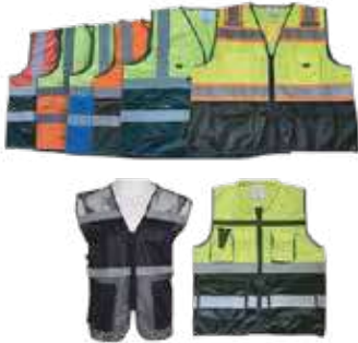
سترة سلامة 3A مهندسين 120 جرام