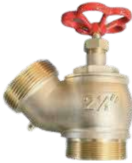
محبس landing valve