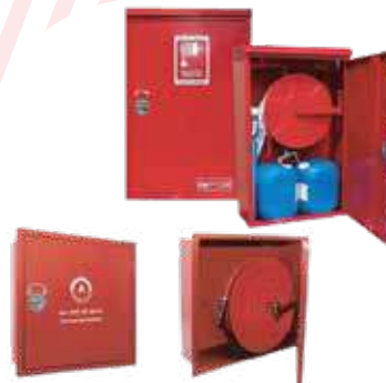
صندوق حريق احمر خارج / داخل الجدار