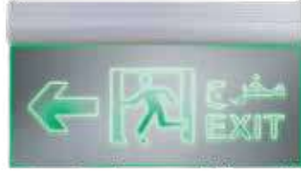
مخرج طوارئ شفاف