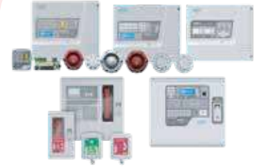
أنظمة الإنذار المعنون (Zeta)