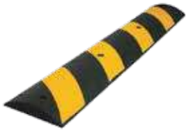
مطب توقف 3A جميع المقاسات (5سم، 7سم)