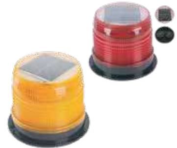
روتاري طاقة شمسية مغناطيس (احمر، اصفر)(صغيرة ، كبيرة)