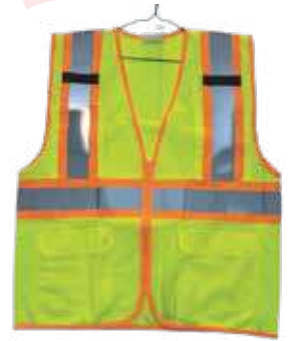
سترة سلامة 3A (مخرم , قماش) 120 جرام