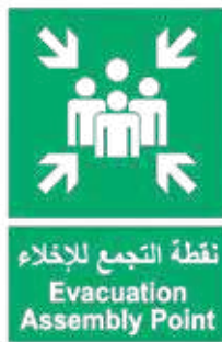
لوحة نقطة تجمع كبيرة