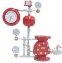
محبس رايزر جميع المقاسات