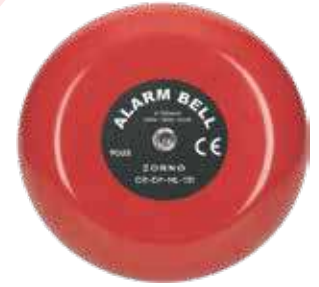
جرس كهرباء 220 فولت