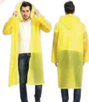
بالطو مطر اصفر (خفيف - ثقيل)