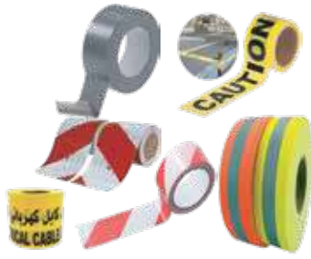
شريط تحذيري لاصق