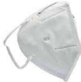
كمام حماية N95