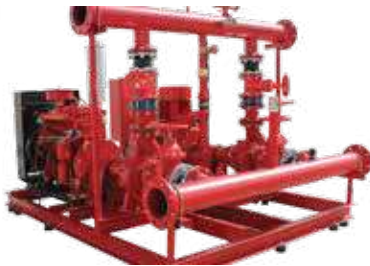
مضخة حريق معتمدة جميع الاحجام