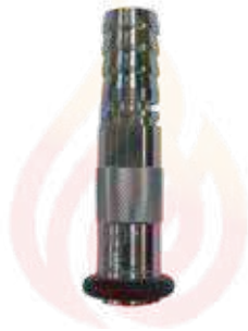
قاذف كروم برم