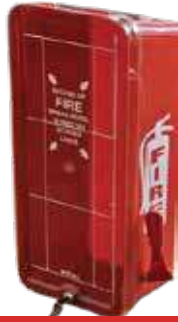
صندوق طفاية حريق بلاستيك