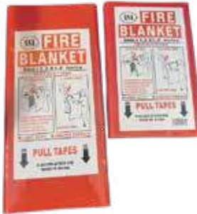
بطانية حريق بلاستيك