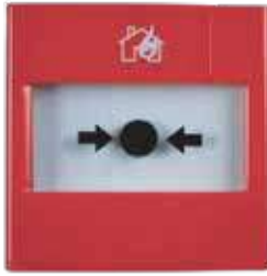
كاسر زجاج 3A