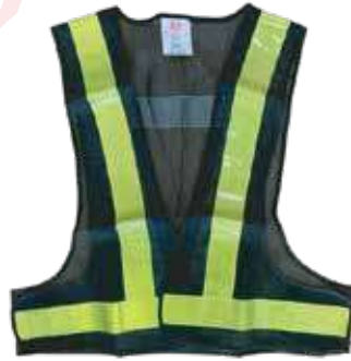
سترة سلامة 3A شبكة عاكس اصفر