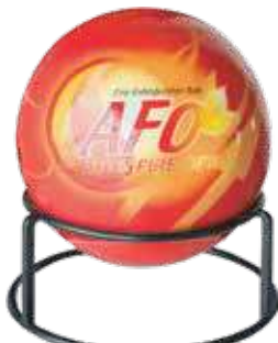
طفاية حريق كورة 3A