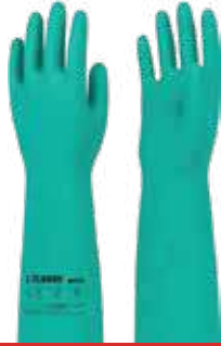
قفازات مواد كيميائية