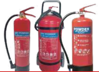
طفاية حريق بودرة جميع الاحجام (ك1 ، ك2 ، ك3، ك4.5، ك6 ، ك10 ، ك25، ك50)