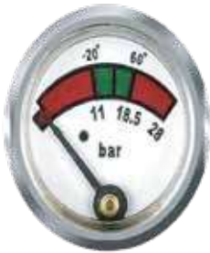
ساعة طفاية جميع الاحجام