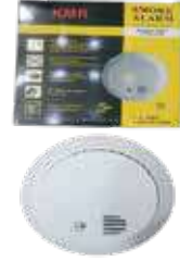
كاشف دخان بطاريه