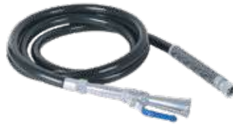
لي طفايات جميع الاحجام