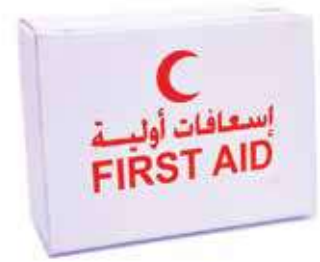
صندوق اسعافات اولية 1