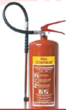
طفاية ويت كيميالك 6 لتر