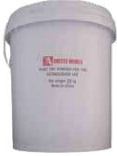
بودرة اطفاء ABC 25Kg