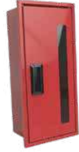
صندوق طفاية حريق حديد