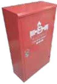
صندوق حريق فوم