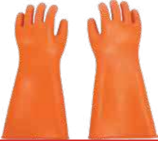
قفاز كهرباء 12000 فولت