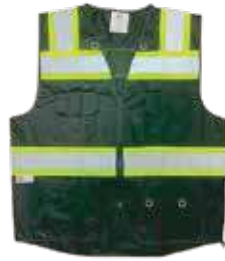
سترة سلامة 3A خط فسفوري 120 جرام