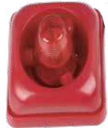
سارينا داخلية صغيرة 3A