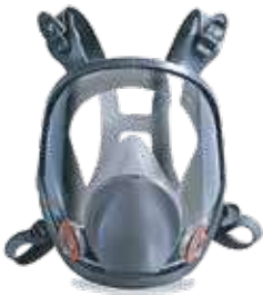
قناع حماية وجه كامل