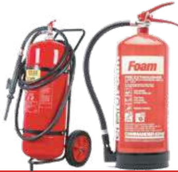
طفاية حريق رغوة (فوم) جميع الاحجام (ك1 ، ك2 ، ك3، ك4.5، ك6 ، ك10 ، ك25، ك50)