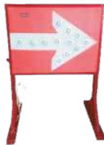
لوحة سهم مضيء