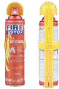
طفاية بخاخ فوم (رغوة)