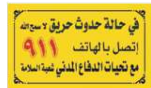
لوحة دفاع مدني