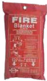
بطانية حريق قماش