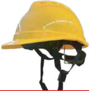
خوذ 3A عمال