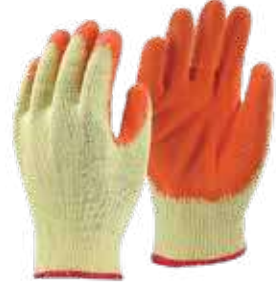
قفاز 3A برتقالي أصفر