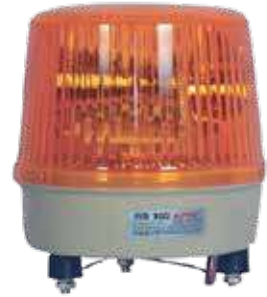
لمبة سفتي أصفر أحمر 24 فولت