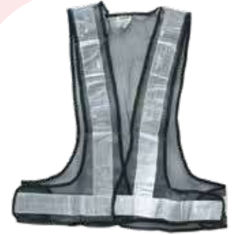
سترة سلامة 3A شبكة عاكس ابيض