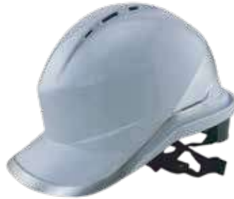
خوذة 3A مهندسين عاكس