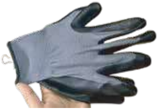
قفاز سلامة مقاوم