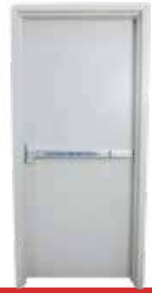
باب طوارئ وطني مقاوم