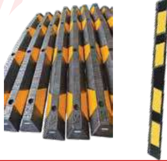
مصدات مواقف 3A جميع المقاسات (33 سم، 50 سم، 90 سم، 180 سم)