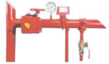
محبس ZCV جميع المقاسات