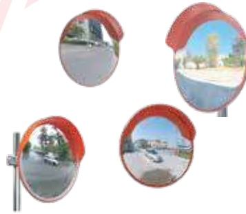
مرايا جميع المقاسات (45 سم ، 60 سم ، 80 سم ، 100 سم)