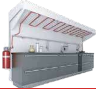
نظام اطفاء FIRETRACE