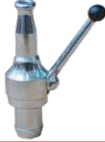
قاذف كروم ابو يد