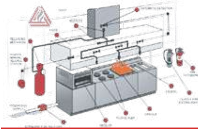
نظام اطفاء kitchen hood