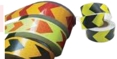
شريط تحذيري عاكس