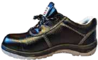
جزمة سيفتي 3A عمال 101