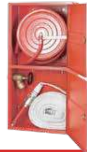
صندوق حريق كلاس 3