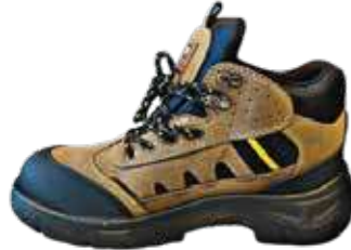
جزمة سيفتي 3A X2 مهندسين