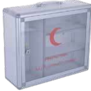
صندوق اسعافات اولية (احجام)