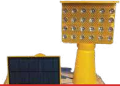
لمبة طاقة شمسية أقمع