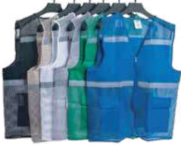
سترة سلامة 3A شبكة 100 جرام