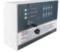
لوحة تحكم انذار 3A