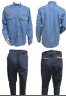
بدلة كات تو 12 كال