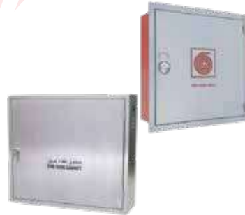
صندوق حريق أستيل خارج / داخل الجدار