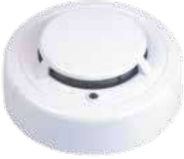
كاشف حراري 3A