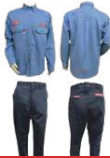
بدلة كات تو 8 كال