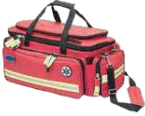
شنطة اسعافات اولية مكتملة للرحلات