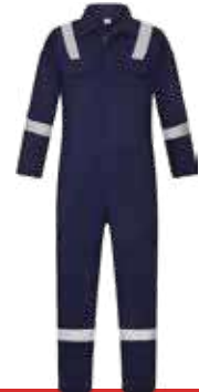
افرول قطعة واحدة