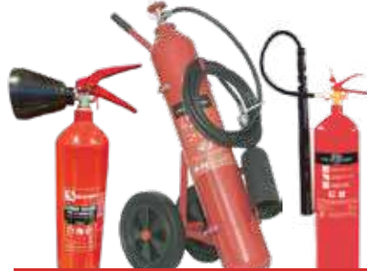
طفاية حريق كربون جميع الاحجام (ك1 ، ك2 ، ك3، ك4.5، ك6 ، ك10 ، ك25، ك50)