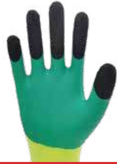
قفاز 3A أخضر أصفر