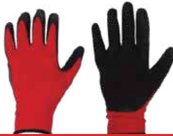
قفاز 3A أحمر أسود