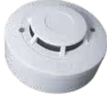
كاشف دخان 3A