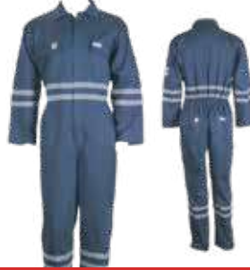
بدلة مقاومة للحريق قطعة واحدة