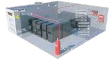
نظام اطفاء CO2