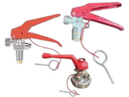
راس طفاية جميع الاحجام