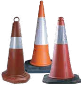
قمع تحذيري جميع الاحجام 50 سم ، 75 سم ، 100 سم