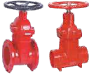
محبس بوابة جميع المقاسات